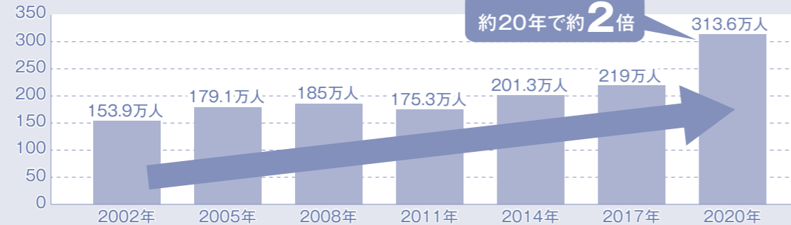
■精神疾患患者数の推移(20~64歳)

※2011年は宮城県の石巻医療圏、気仙沼医療圏および福島県を除いた数値